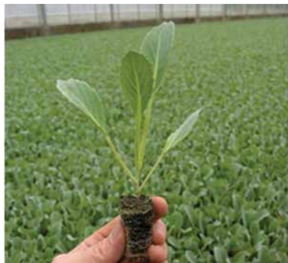
Фото 6. Рассада капусты