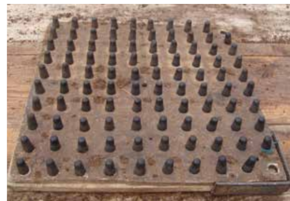
Фото 2. Наколка на 100 ячеек

При ручном посеве в кассеты иногда используют самодельные «наколки» (см. Фото 2 ), для проделывания лунок глубиной 5 мм, в которые сеют семена капусты и посыпают либо вермикулитом крупной фракции, либо торфом.